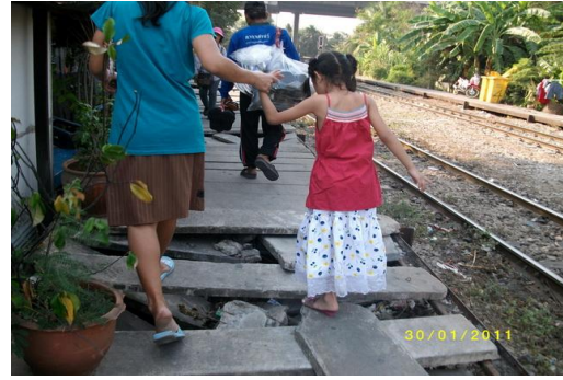
ตัวอย่างภาพถ่ายความเสียหายเส้นทางเดิน